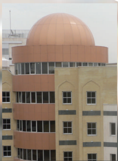
دفتر تبلیغات اسلامی خراسان رضوی

آدرس: مشهد، چهارراه خسروی، ابتدای خیابان شهید رجایی